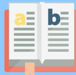
適性入學宣導墊板