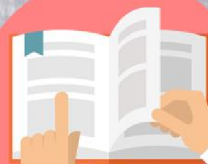
105學年度 免試入學續招資訊網