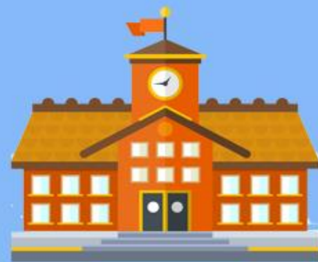
高級中等學校公告轉學資訊網