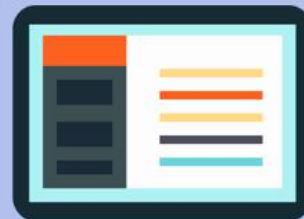
全國各入學委員會網站