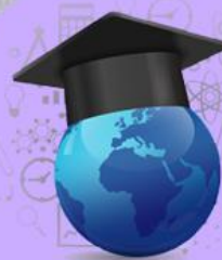
高中學科 高職群科及五專介紹