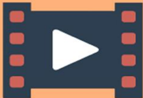
技職教育宣導影片