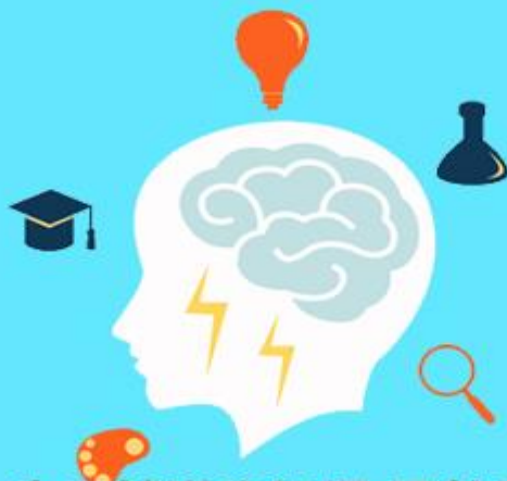
生涯輔導資訊網(國教署)