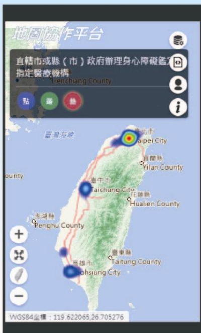
熱區圖 Heat Map