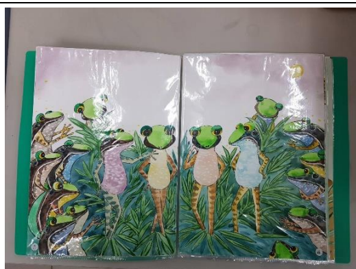
手繪作品原稿依序放入資料夾提交 (勿裝訂、打孔)