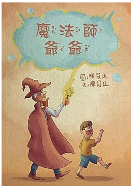
作品規格-A4 尺寸直式 (高 29.7cm×寬 21cm)