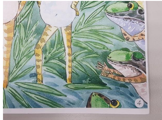
彩色影印樣書(文字編排貼上)