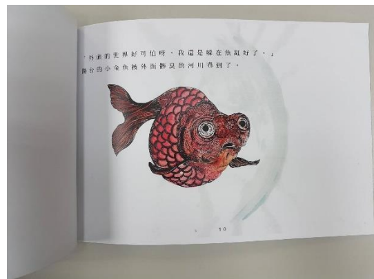
樣書範例(A4 彩印加文字頁碼)