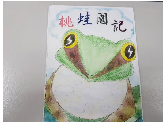
作品原稿(請勿書寫文字及頁碼)