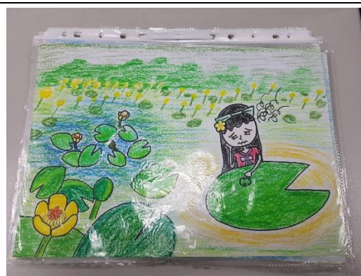
手繪作品原稿依序放入資料夾提交 (勿裝訂、打孔)