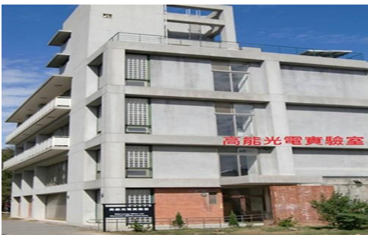
5. 奕園停車場→高能光電實驗室