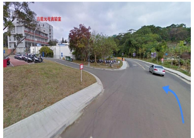
4. 南校區廢水處理廠 →左轉 奕園停車場