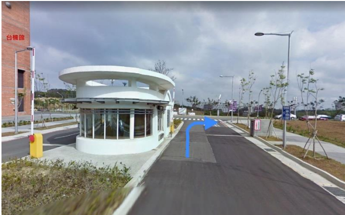
1. 南門口→右轉 育成創新大樓