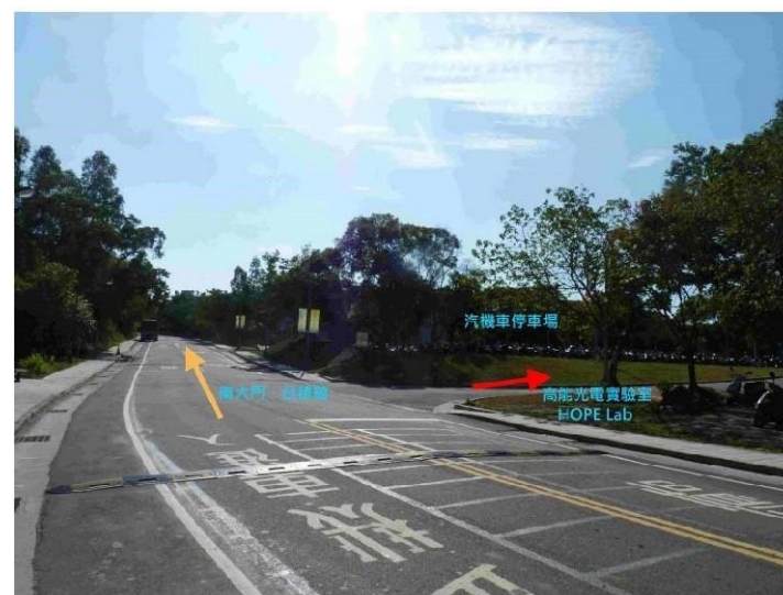
|7 荷塘→奕園汽機車停車場|