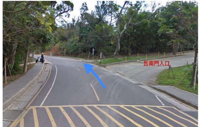
2. 育成創新大樓→ 舊南門入口