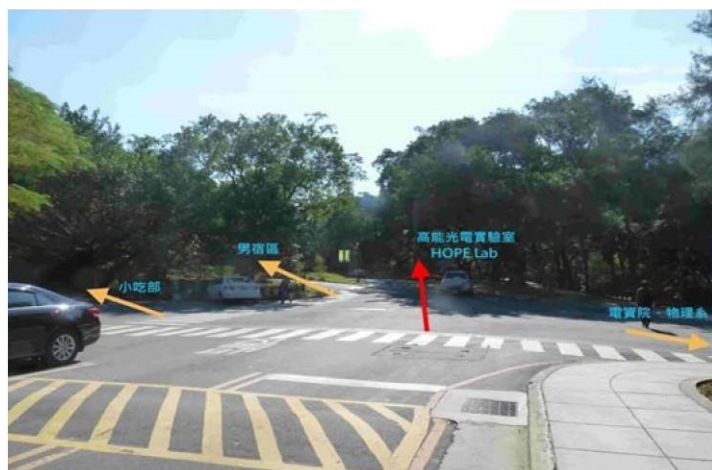
|3 圖書館→野台(小吃部旁)