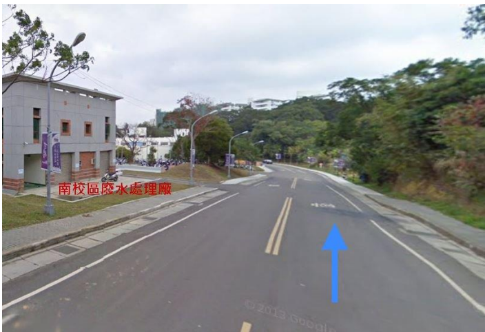
3. 舊南門入口→南校區廢水處理廠