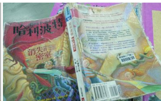
書況不佳、破損脫頁