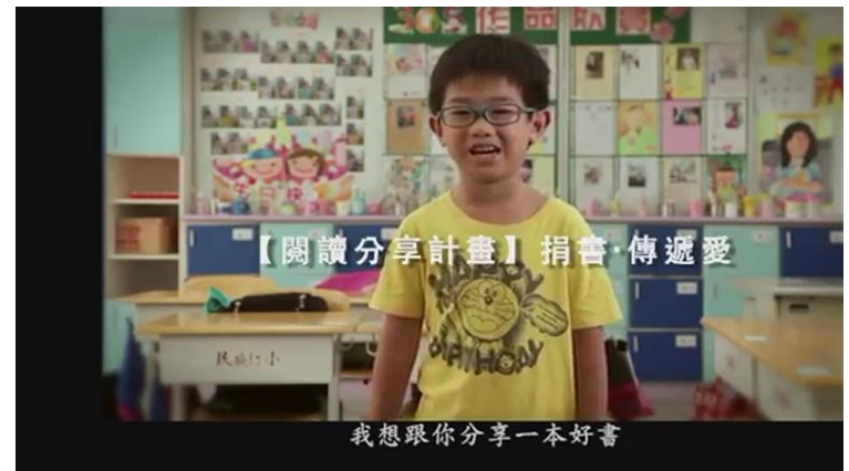
【誠品文化藝術基金會】2015募書篇 (1分鐘版本)

歡迎募書夥伴以影片、照片、故事或文字的方式分享募書過程， 我們將透過官網、臉書或電子報 發佈募書訊息和小故事！