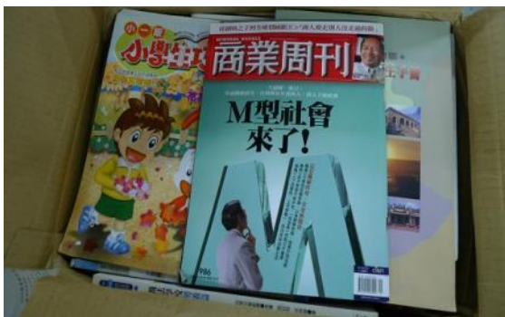
超過3年時效性雜誌