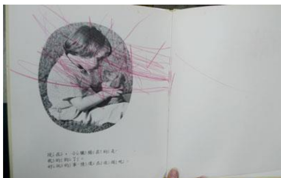
污漬塗鴉，影響閱讀