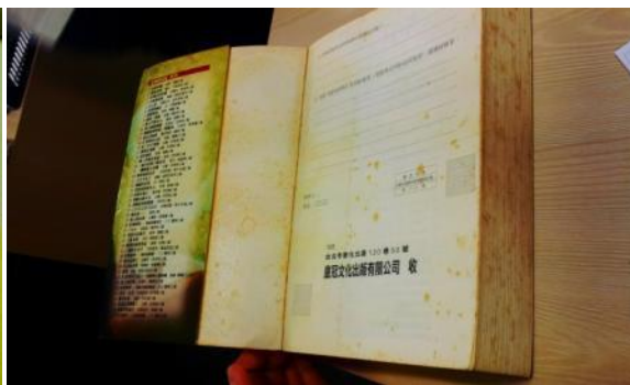
年代久遠、泛黃嚴重