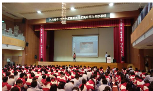
講師與學生 Q&A 時間