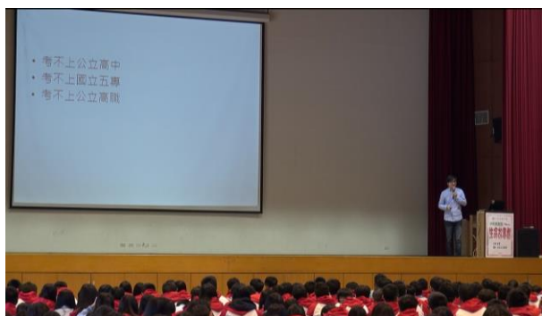
面對生涯抉擇的時刻