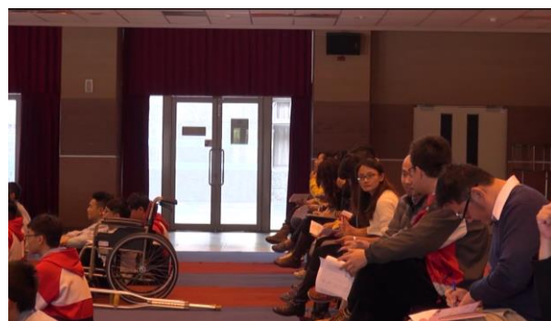
班級 PLC 教師也一同參與講座