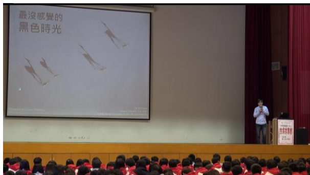
國中時代的黑暗時光