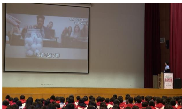
如何看待生命中重要的事