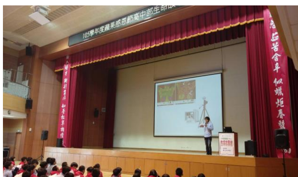
講師的專業領域研究