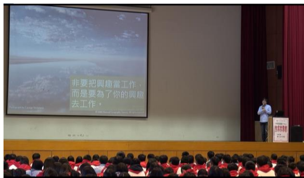
鼓勵學生找到自己的興趣