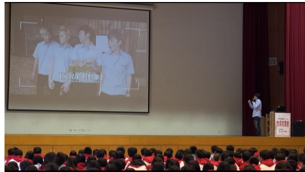
國中時期追求同儕的認同