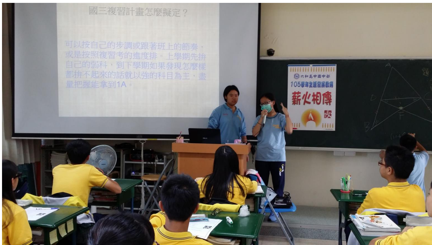
5A++直升高中部學姊分享讀書計畫的擬定方式