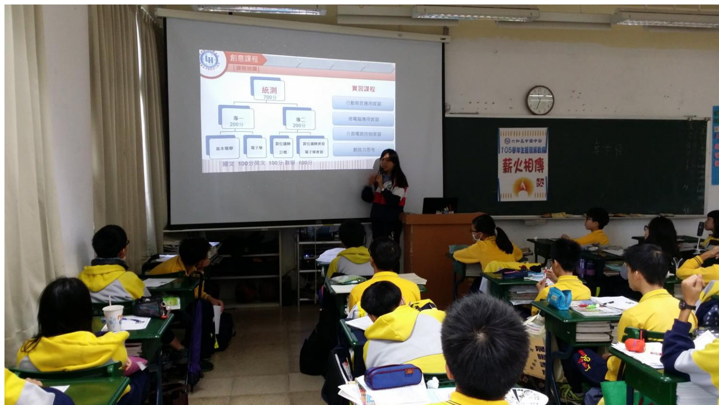
資訊科學姊分享資訊科的學習內容