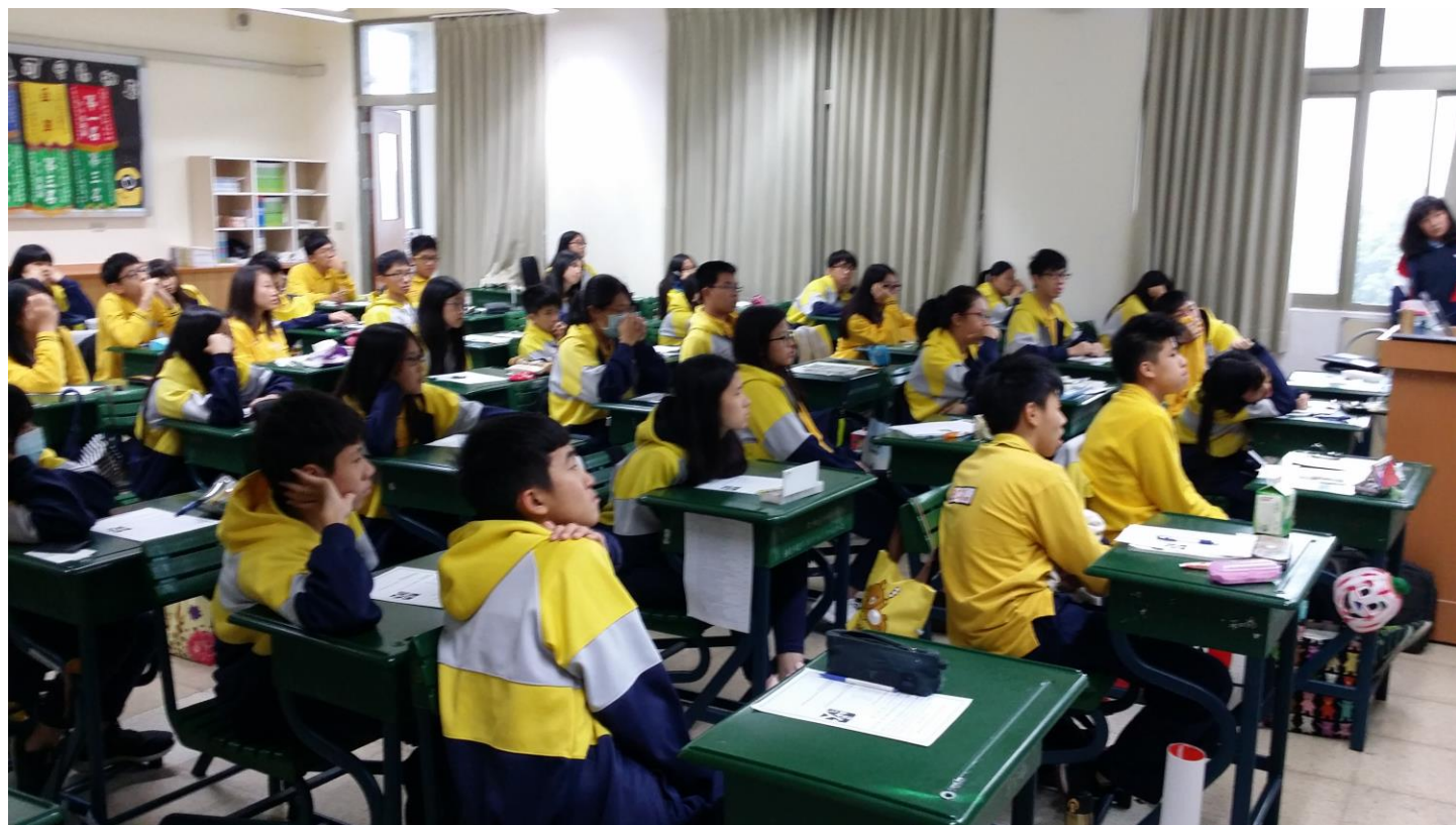
認真參與的國三學生