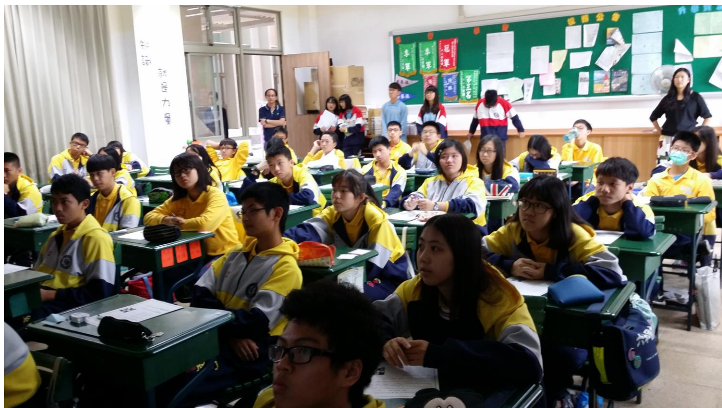
國三學生聚精會神的聆聽並進行筆記