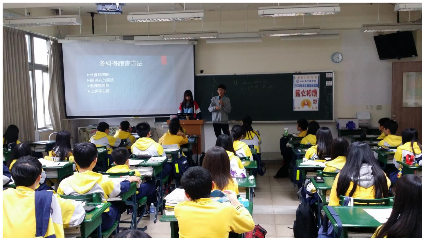
多媒科學長分享自己的學習樂趣!