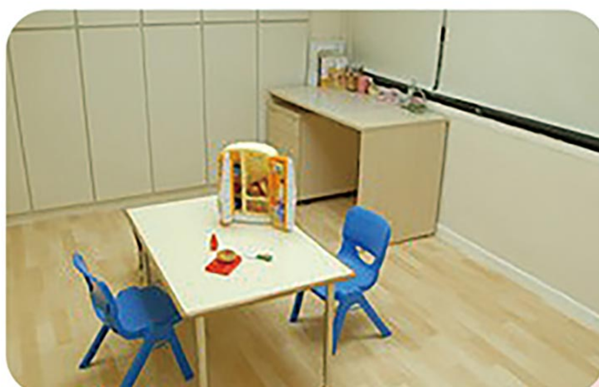
有愛無礙的中華醫大語言治療中心

連絡電話：06-2674567 分機445 專線：0952071769 (Line ID)