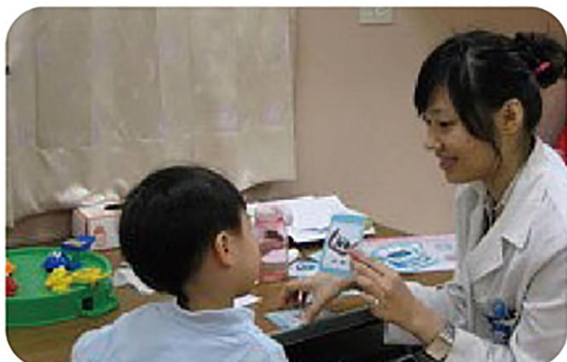
臺大醫院兒童語言治療的實習課程是中華醫大簽訂合作醫院之一