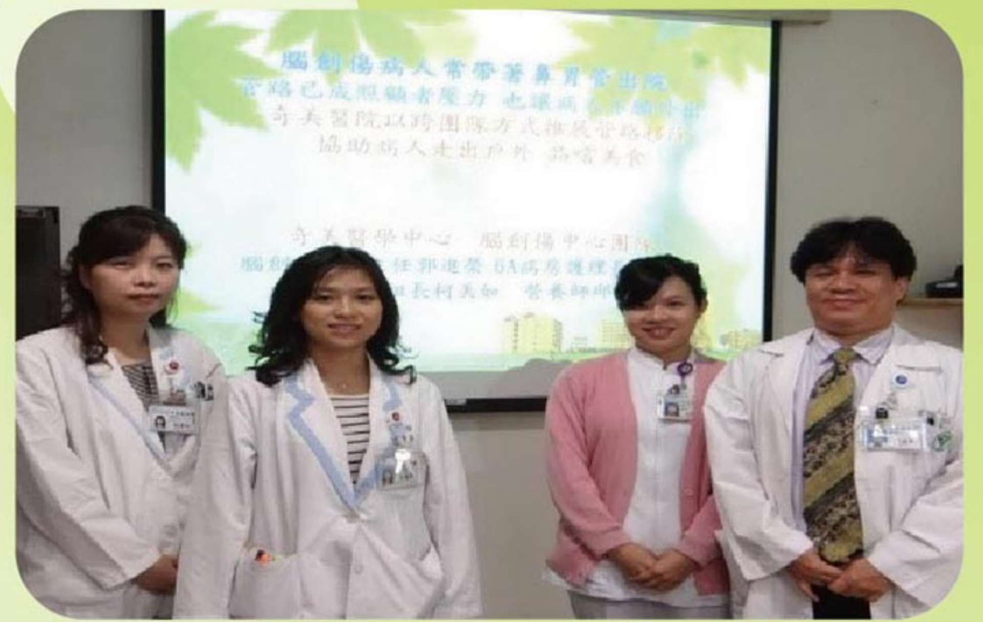
奇美醫院吞嚥治療團隊是本校師資陣容之一