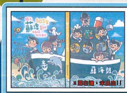
✗未留包折白邊是錯誤的!