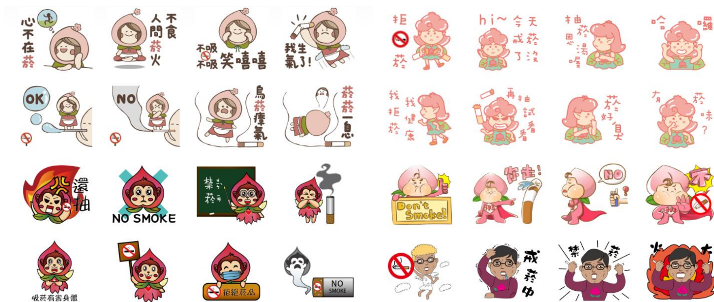
圖 2.禁菸 Line 貼圖圖樣